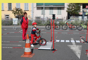
PRÉVENTION ROUTIER_2RM_