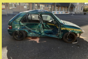
VOITURE CRASH TEST_

Le village du 2 roues , à Tulle, le 2 octobre : franc succès pour la journée des deux-roues à Tulle, place Martial Brigouleix, avec les ateliers suivants : casque choc Macif, moto mystère, démonstration air bag, simulateur deux-roues, trajectoire sécurité, piste maniabilité, info permis, engins de déplacement personnel à moteur (EDPM, ex : trottinette électrique), piste vélo, atelier révision vélo, démonstration vélo à assistance électrique (VAE), manège à vélo, qu'un public venu en nombre a pu apprécier. Une cinquantaine de motards a également pu bénéficier des précieux conseils des gendarmes motocyclistes de l'Escadron Départemental Sécurité Routière de la Corrèze, au cours des différentes sorties.